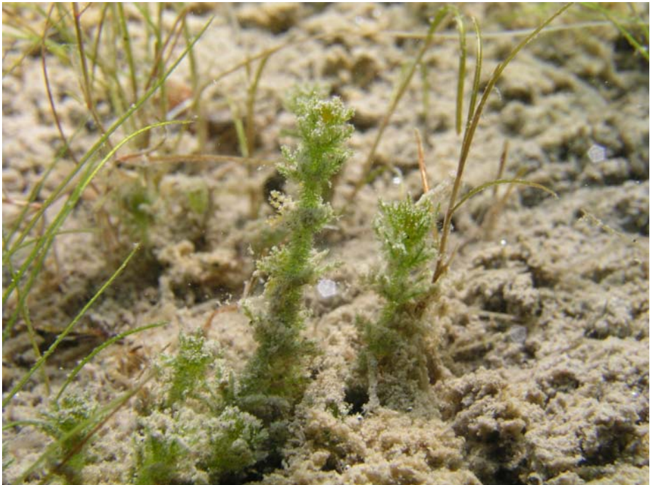
Abbildung 1: Brackwasser-Armleuchteralge ( Chara canescens ) im Flachwasser des Borkener Sees; 2009, Klaus van de Weyer.

Die Brackwasser- oder Graue Armleuchteralge ( Chara canescens ) ist die einzige Armleuchteralge in Deutschland, bei der Rindenreihen und Äste in gleicher Anzahl vorliegen (haplostich); sie ist zugleich die einzige deutsche Characee, die sich parthenogenetisch fortpflanzt. In Deutschland kommen nach Krause (1997) nur weibliche Populationen vor.